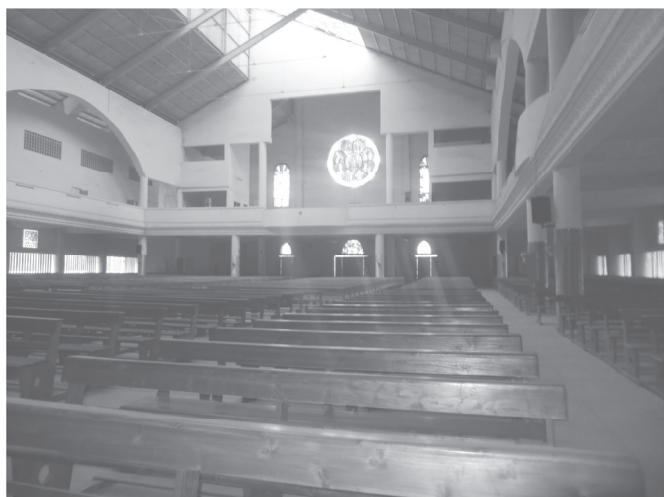
Interior de la Basílica de Dassa

centre. Ens expliquen que va ser erigida l'any 2002 després de la visita del Papa Joan Pau II a la gruta de Nostra Senyora d'Arigbo que hi ha darrera de la basílica. Diuen que l'any 1954 s'hi va produir un fet miraculós, ja que hi van trobar una imatge de la verge Maria; per aquest motiu el bisbe de Benín el va convertir en un lloc de pelegrinatge; el Lourdes de l'Àfrica. Des de llavors la gruta de Nostra Senyora d'Arigbo no ha parat de rebre pelegrins en busca d'esperança i redempció. El 15 d'agost de cada any s'hi congreguen un gran nombre de persones provinents de Togo, Nigèria i Burkina Faso per fer una festa de tres dies. La primera impressió que tinc és una mica de decepció: m'imaginava que la basílica seria com les nostres però és molt gran, de construcció moderna i poc acollidora. Em sorprèn veure aquelles creus i el gran Déu fet amb llums fluorescents. Hi trobem poca gent, només algunes persones que van caminant mentre resen. Em crida l'atenció un pare que acompanya el seu fill amb discapacitat i que