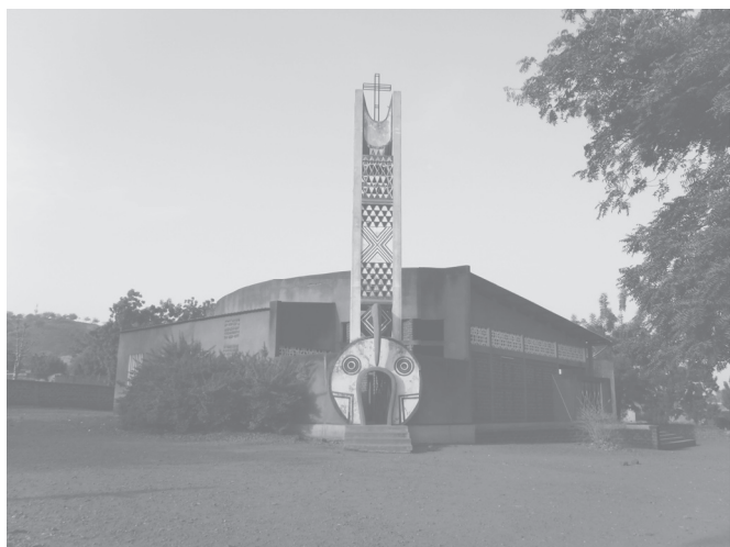
Església cristiana de Boni a Burkina Faso

La religió catòlica es practica per un 25% de la població.