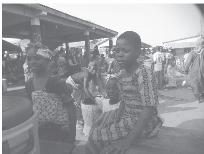
Les dones compren al mercat

En el nostre viatge per Burkina Faso fem una parada al poble de Boni, entrem en una església cristiana amb una creu a dalt, però em crida l'atenció que a la porta té una màscara que representa el sol i la lluna, amb un bec d'ocell, anomenat kalao, que és un signe de protecció. Ho trobo original i m'adono que en aquest detall s'hi pot captar l'animisme. Aquest contrast referma el sincretisme que traspua l'ambient. La porta està oberta, entro i m'assec en un dels bancs —que per cert no és gaire còmode perquè és de ciment i sense respall. Per celebrar les festes de Nadal, l'església està tota decorada amb símbols nadalencs i un pessebre fet amb figures de fang. Quan sortim a fora, anem a casa l'artista Yakoumba, que és l'autor de la màscara de la porta de l'església, un símbol ani-