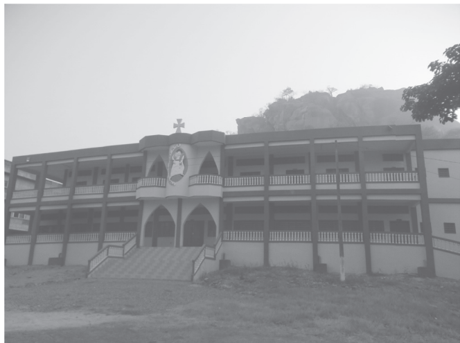
Basilica catòlica de Dassa a Benín

centre. Ens expliquen que va ser erigida l'any 2002 després de la visita del Papa Joan Pau II a la gruta de Nostra Senyora d'Arigbo que hi ha darrera de la basílica. Diuen que l'any 1954 s'hi va produir un fet miraculós, ja que hi van trobar una imatge de la verge Maria; per aquest motiu el bisbe de Benín el va convertir en un lloc de pelegrinatge; el Lourdes de l'Àfrica. Des de llavors la gruta de Nostra Senyora d'Arigbo no ha parat de rebre pelegrins en busca d'esperança i redempció. El 15 d'agost de cada any s'hi congreguen un gran nombre de persones provinents de Togo, Nigèria i Burkina Faso per fer una festa de tres dies. La primera impressió que tinc és una mica de decepció: m'imaginava que la basílica seria com les nostres però és molt gran, de construcció moderna i poc acollidora. Em sorprèn veure aquelles creus i el gran Déu fet amb llums fluorescents. Hi trobem poca gent, només algunes persones que van caminant mentre resen. Em crida l'atenció un pare que acompanya el seu fill amb discapacitat i que