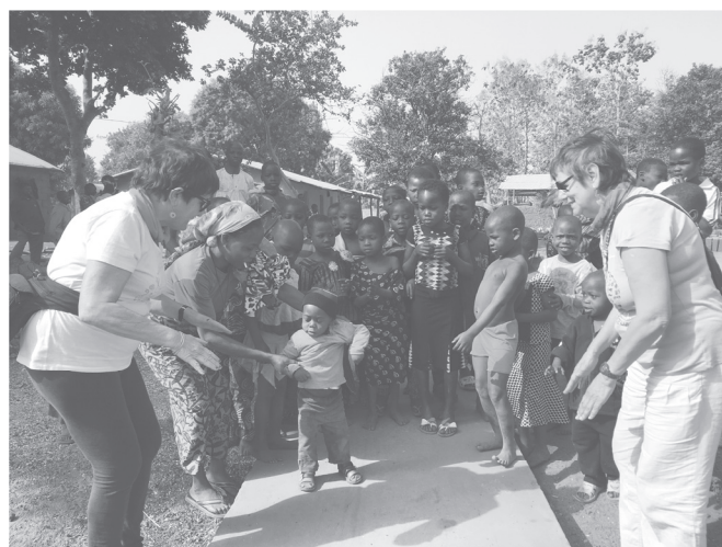
Dansem amb els nens d'un poblats

Recordo amb molt d'afecte els nens dels poblats. Vam tenir molt bona connexió: vam dansar, cantar i ens ho vam passar molt bé. També les visites als mercats, em vaig deixar portar pels sentits: les olors, els crits dels venedors, els colors vius de les verdures i les fruites. En les passejades entre la gent vaig poder comprovar que no són només llocs on comprar i vendre: són espais de trobada i de relació que reflecteixen la vida de cada lloc. Vaig sentir-me com un d'ells. Per mi el més important de Benín és la seva gent.